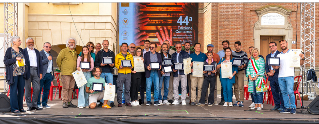
Castel San Pietro Terme: evento di premiazione Tre Gocce d'Oro, settembre 2024.