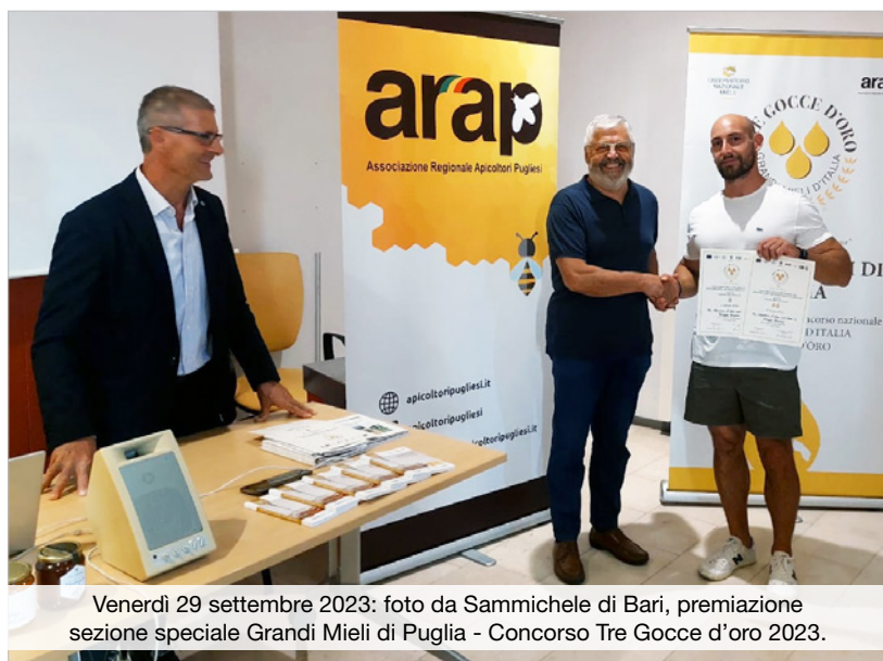
Venerdì 29 settembre 2023: foto da Sammichele di Bari, premiazione sezione speciale Grandi Mieli di Puglia - Concorso Tre Gocce d'oro 2023.

Partecipano infatti a questa sezione i mieli prodotti da apicoltori pugliesi nel territorio della Puglia, regione già storicamente tra le più rappresentate al Concorso Tre Gocce d'Oro: oltre il 10% dei campioni che partecipano annualmente proviene da apicoltori pugliesi (numero fortemente cresciuto da quando è stata istituita la sezione speciale), nonostante tra tutte le regioni italiane sia una di quelle con il minor numero di alveari dichiarati in BDA.