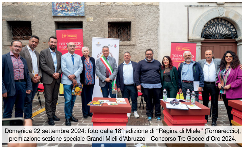
Domenica 22 settembre 2024: foto dalla 18° edizione di “Regina di Miele” (Tornareccio), premiazione sezione speciale Grandi Mieli d'Abruzzo - Concorso Tre Gocce d'Oro 2024.

L'intero territorio dell'Abruzzo è storicamente caratterizzato da una forte tradizione apistica; l'apicoltura abruzzese si caratterizza per un elevato livello di professionalità basata sul nomadismo a lunga distanza, tuttavia le produzioni più tipiche e tradizionali sono quelle della locale montagna appenninica. In Abruzzo, infatti, le aree protette rappresentano circa il 30% dell'intero territorio regionale, che