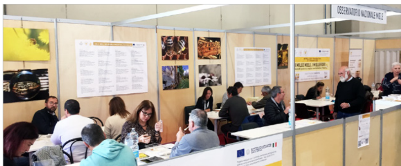
Foto da Apimell 2023: assaggi sezione speciale “I Mille Mieli, I Mille Fiori”.