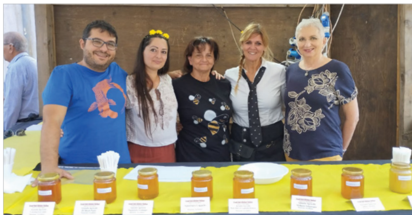
Sabato 30 settembre 2023: foto dalla 41° Sagra del Miele di Sortino, premiazione sezione speciale Grandi Mieli di Sicilia – Concorso Tre Gocce d'oro 2023.

La valorizzazione dei mieli del territorio siciliano è tra gli scopi principali di ARAS, in una regione in cui le tipicità certo non mancano, come per esempio testimoniato dall'esistenza di ben 2 Presidi Slow Food (su 6 totali in Italia): Ape Nera Sicula e Miele di Timo Ibleo.